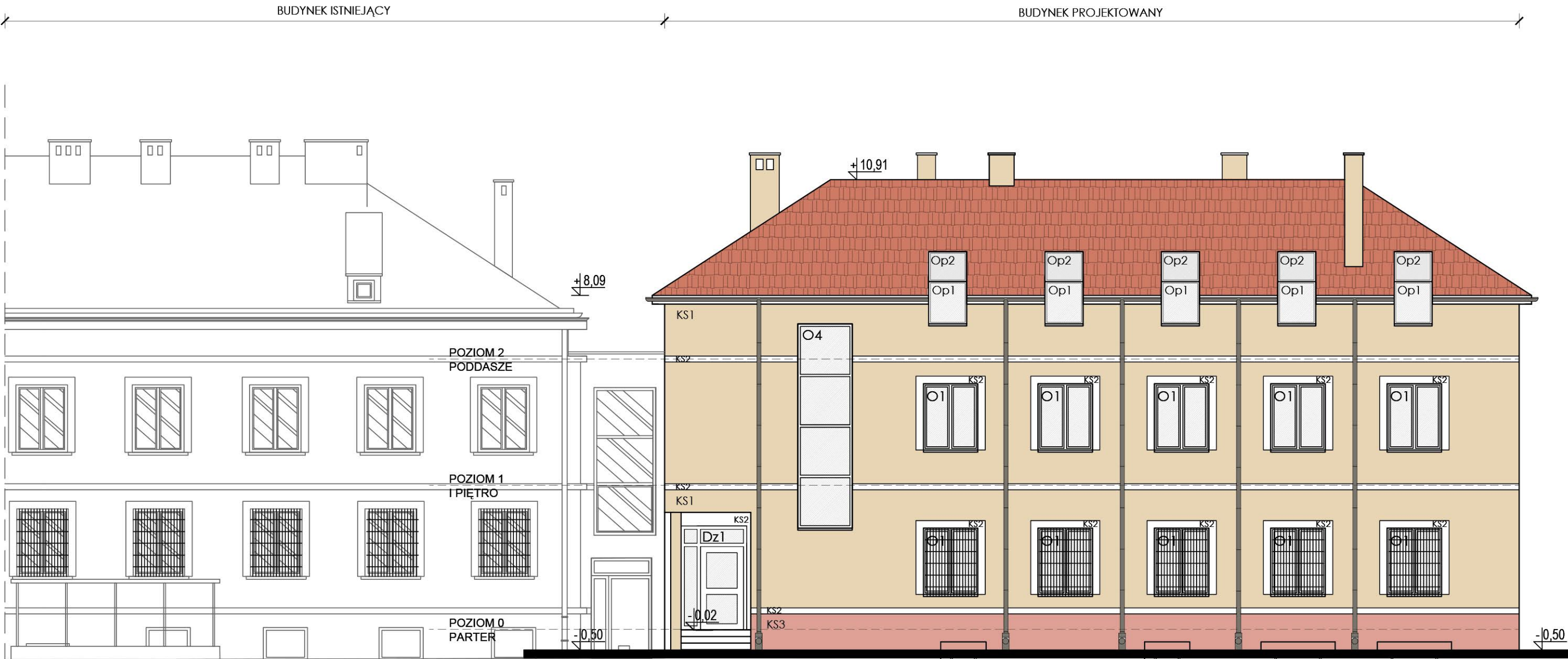
ROZBUDOWA SIEDZIBY KOMENDY POWIATOWEJ POLICJI PRUSZCZ GDAŃSKI ELEWACJA PÓŁNOCNA SKALA 1:100